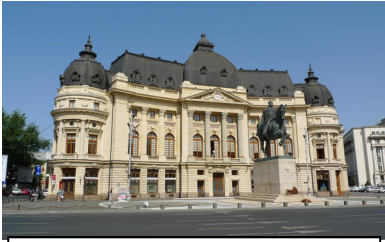
Biblioteca Centrală Universitară „Carol I”

Thank you so much for being in the library of Faculty of Dental Medicine University of Lisbon, all the books, all the articles - databases, all the news here. I recommend for all the post-graduate students, this place.